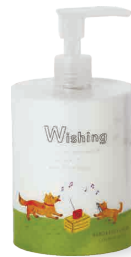
LAVENDER APPLE とてもしっとり