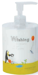
FRESH ORANGE しっとり