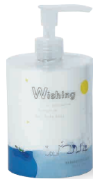
SNOW LEAF さっぱり