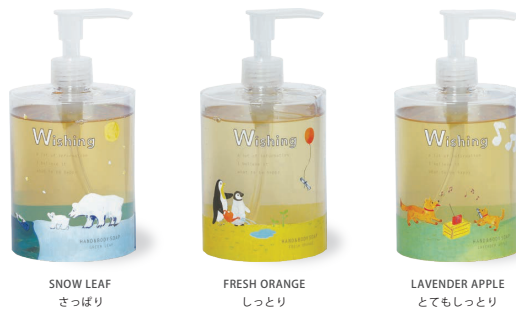
SNOW LEAF さっぱり